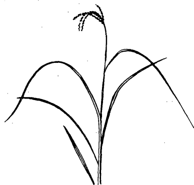
第2図 第7区の稲の姿勢

第1図のV字型曲線の生起する理由を探した結果、最大要因は稲の姿勢であることがわかった。